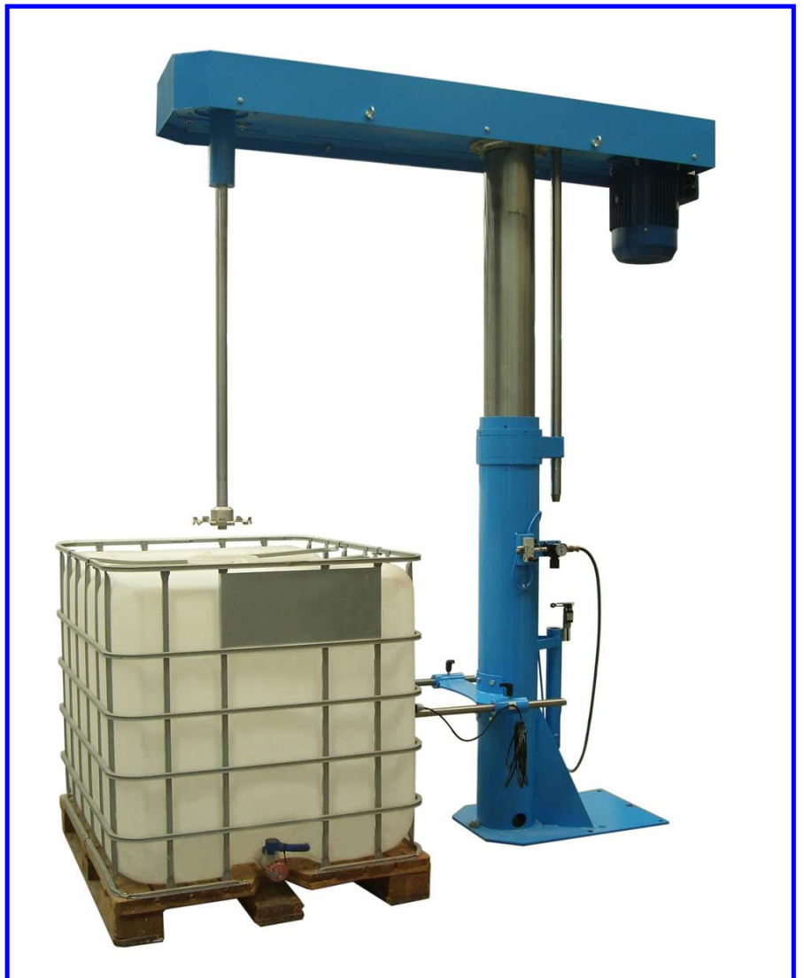
Detalle del Agitador en contenedores